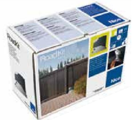
ROADKIT Para puertas correderas Nice

Por exigencia de almacenamiento, envío y uniformidad de los paquetes, se aconseja pedir el producto en paletas. A tal fin se ha indicado la cantidad de paquetes por cada palet. Diseño exclusivamente indicativo.