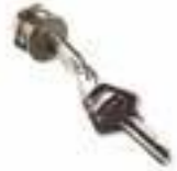
CM-B TRINQUETE CON DOS LLAVES METÁLICAS DE DESBLOQUEO.